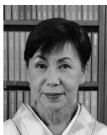
田中優子 法政大学名誉教授 江戸研究

1932年、福岡県生まれ。戦後、北朝鮮より引揚げ。早稲田大学文学部ロシア文学科中退。『さらばモスクワ愚連隊』で小説現代新人賞、『蒼ざめた馬を見よ』で直木賞、『青春の門』で吉川英治文学賞を受賞。ほか代表作に『風に吹かれて』『朱鷺の墓』『戒厳令の夜』『蓮如』『風の王国』『大河の一滴』『TARIKI』『親鷲』、近著に『捨てない生き方』がある。