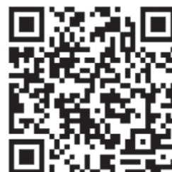
専用サイト用 QRコード