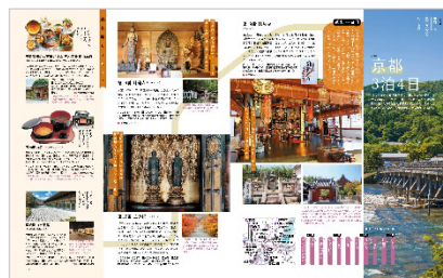
<第2章誌面例（制作途上につき 予定内容となります）>