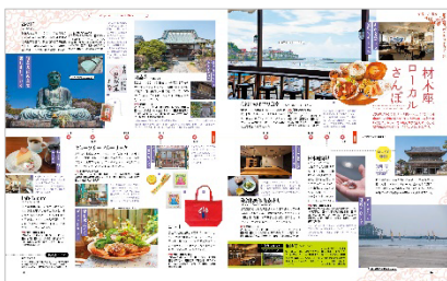
<第1章誌面例（制作途上につき 予定内容となります）>