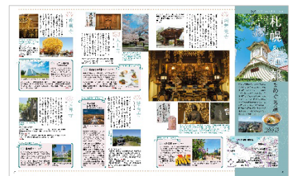
<第4章誌面例（制作途上につき 予定内容となります）>